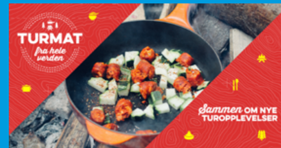
Standard FB-banner 1200 x 628 px