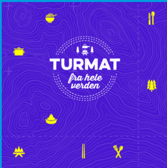
Standard FB-banner 1200 x 1200 px