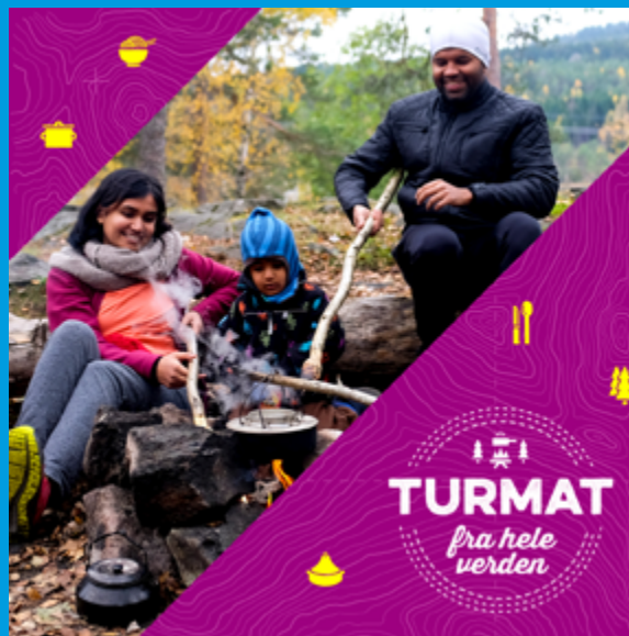
Standard FB-banner 1200 x 1200 px